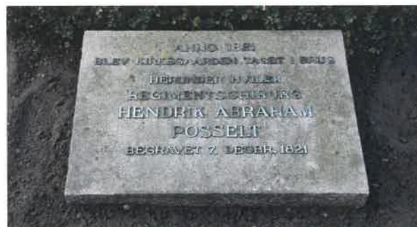
Mindesten for de to første begravelser i 1821.